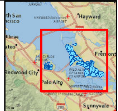
Figure 1/Figura 1 Cargill Solar Salt System Project Area and Vicinity

Cargill, Incorporated Alameda and San Mateo County, CA