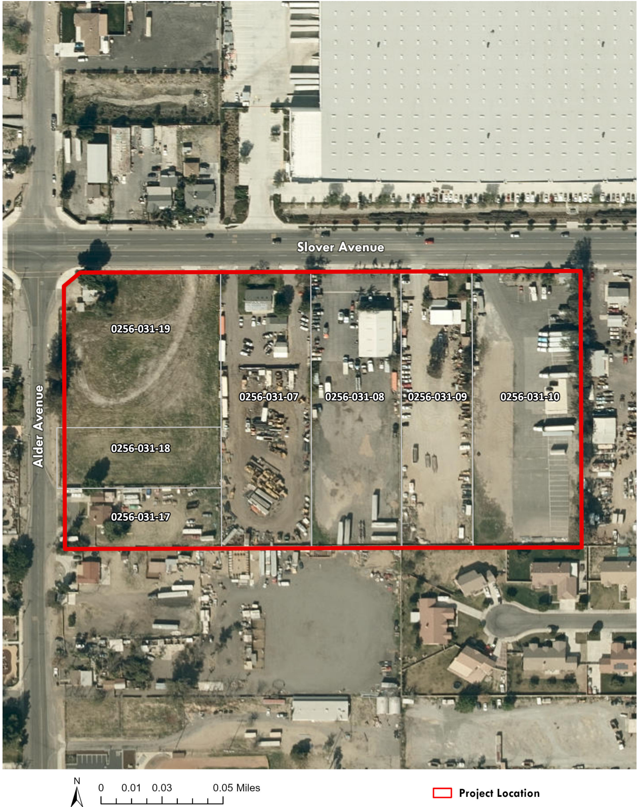
Duke Warehouse on Slover & Alder