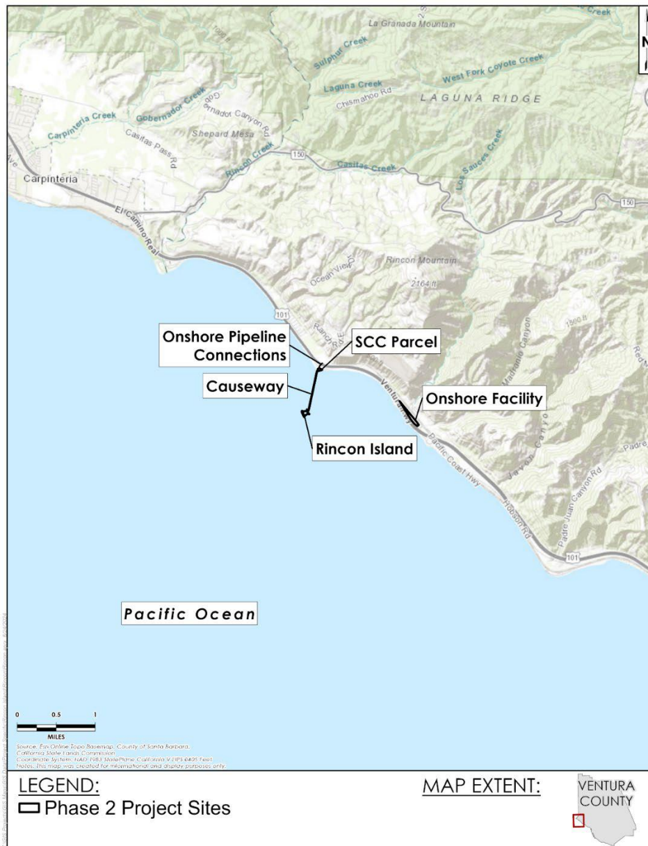
Figura ES-1. Mapa de ubicación de emplazamientos

calzada dentro del Número de Parcela de Tasador (APN) 060-0-090-425. Las instalaciones en tierra asociadas, que consisten en una parcela de 6,01 acres propiedad del Estado, está situada a 1,3 millas al este de Isla Rincón, en el 5750 W. Pacific Coast Highway (PCH), Ventura. Isla Rincón y las instalaciones en tierra estaban conectadas anteriormente por un sistema de tuberías, hasta que se desconectaron como parte del proceso de taponamiento y abandono de los pozos de petróleo y gas de la instalación (Fase 1). La Figura ES-2 ofrece una visión general de los emplazamientos propuestos para el Proyecto.